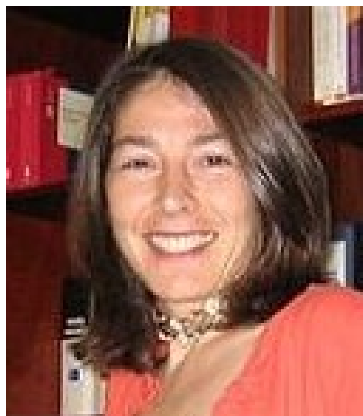
Marta Requejo Isidro Catedrática de Derecho internacional privado. Letrada del Tribunal de Justicia de la Unión Europea