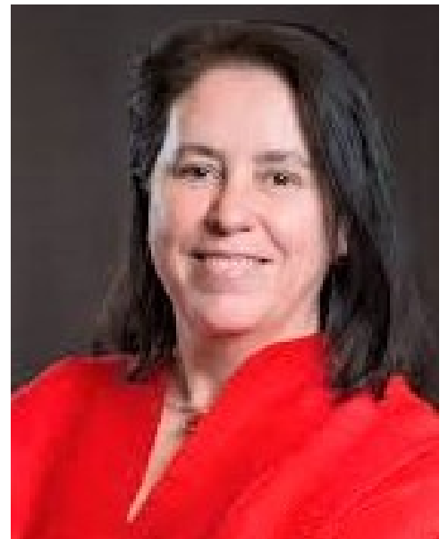
Urquiola de Palacio del Valle de Lersundi Presidenta de la Corte de Arbitraje de Madrid