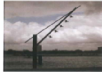
Imagen 2 Instalación farola LATINA de Beth Gali en Piet Smit Terrain Rotterdam (Netherlands), 1998